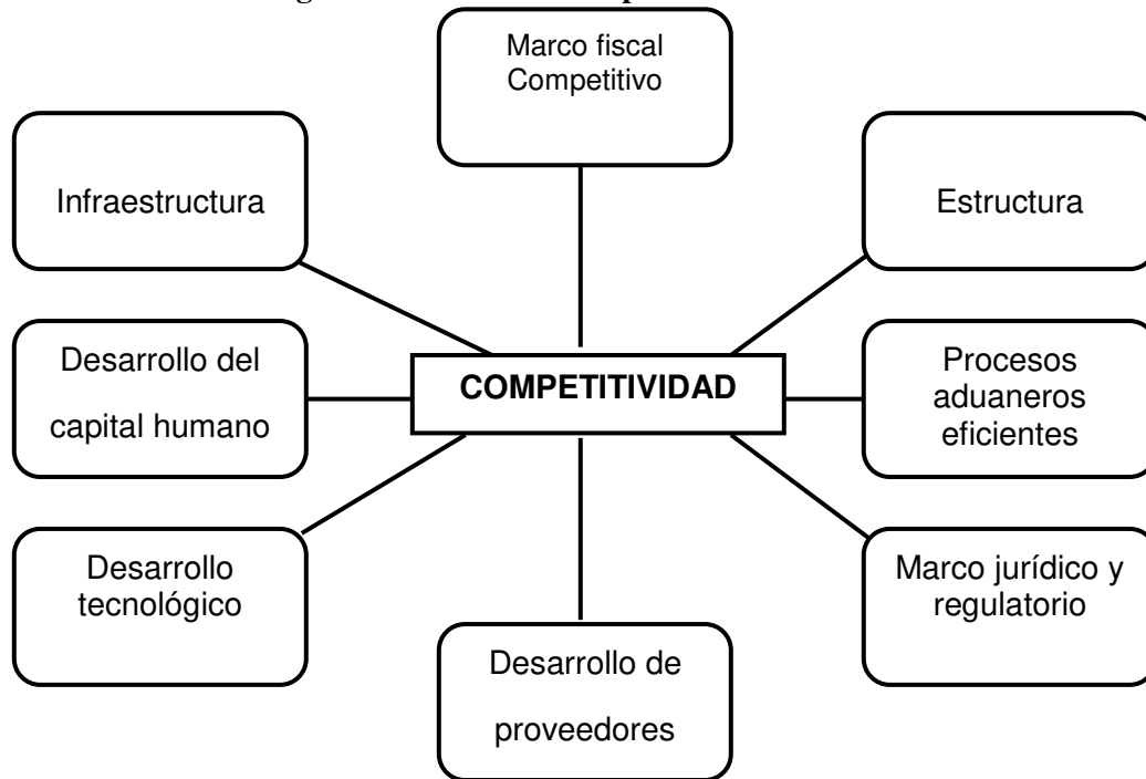
Figura 1. Modelo de Competitividad en China