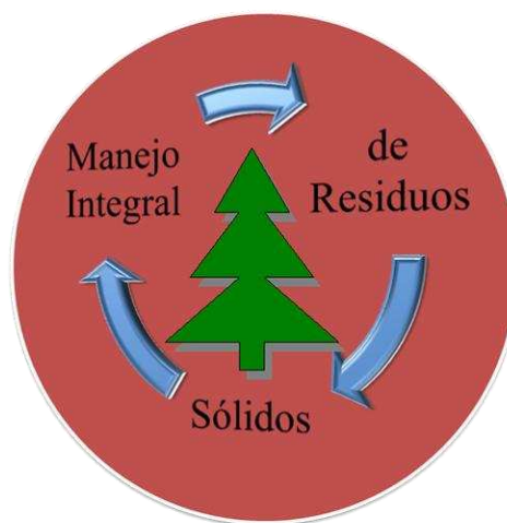
Figura 2. Modelo Integral de Residuos Sólidos.

En lo sucesivo, el Modelo de Manejo Integral de Residuos Sólidos, se mencionará como MIRS, como se muestra en la figura 2.