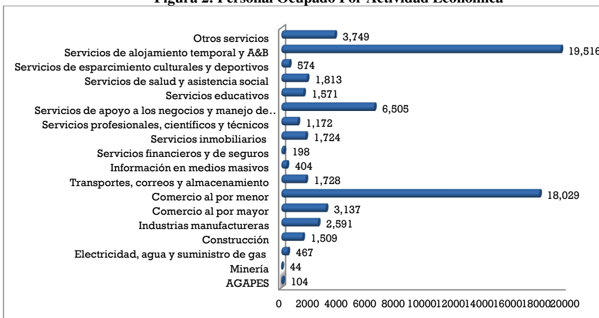
Figura 2: Personal Ocupado Por Actividad Económica