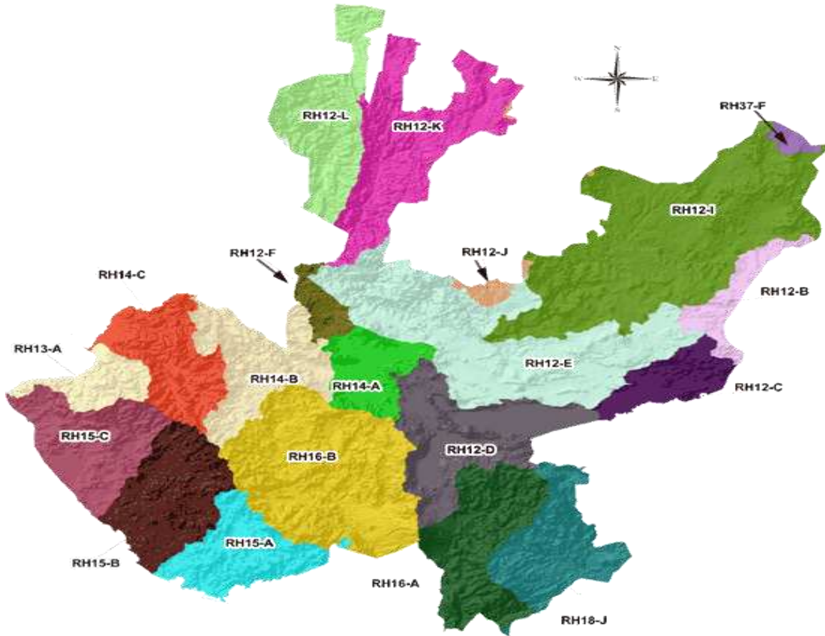
Mapa No. 2: Las 20 cuencas hidrológicas en Jalisco.