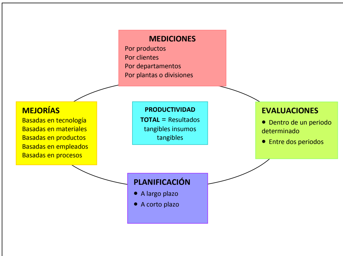
Figura 2.1. Modelo de la productividad.

En la perspectiva de la productividad total, todas las mejoras parten de un sistema de medición basado en la productividad. Una taxonomía de las metodologías para la medición de la productividad confirma el hecho de que, desafortunadamente, la mayoría de los sistemas de medición están orientados hacia la productividad parcial. De todos los sistemas de medición basados en la productividad total, únicamente el modelo de productividad total de Sumanth es aplicable a todos y cada uno de los niveles, desde el aspecto corporativo hasta la especificación de las tareas por realizar, así entonces, a continuación presentamos este modelo.