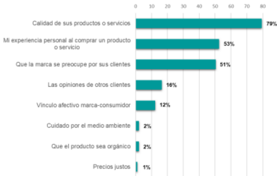
Percepción de los atributos que hacen valiosa a una marca