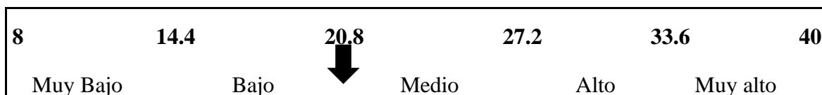
Figura No1 Representación gráfica del resultado promedio de los encuestados al cuestionario.