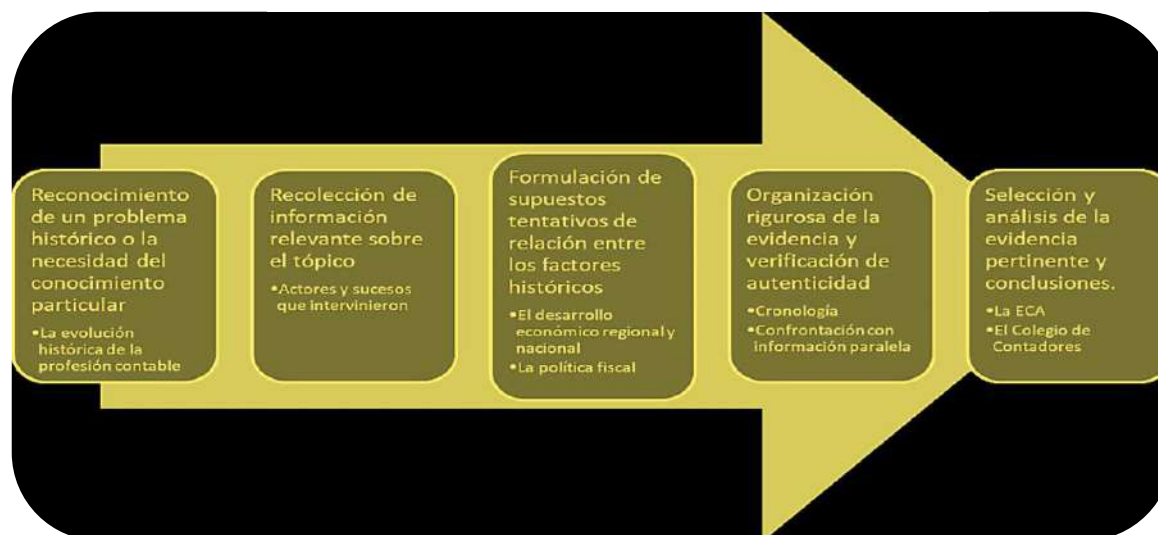
Figura 1. Proceso historiográfico de investigación