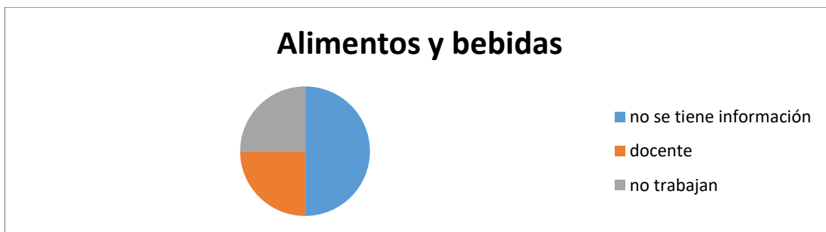
Gráfica 2. Especialidad de alimentos y bebidas

De los alumnos que seleccionaron la especialidad de alimentos y bebidas se tiene que 4 alumnos que representan el 50% de ellos no se encuentran laborando dentro de su especialidad, sino como docentes, o no trabajan.