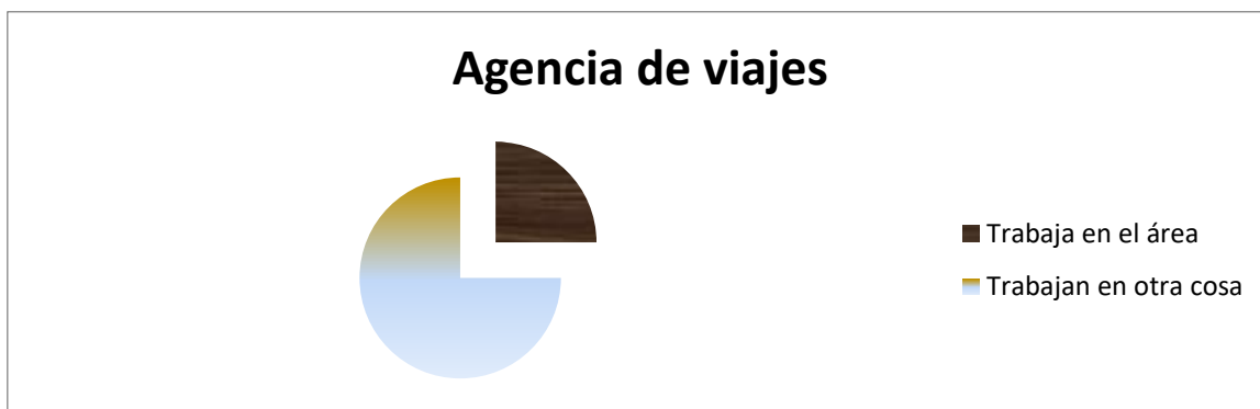
Gráfica 5. Especialidad de agencia de viajes

Con relación de agencias de viajes únicamente 1 que representan el 33% trabaja en una agencia de viajes y los otros 67% no están laborando en la especialidad.