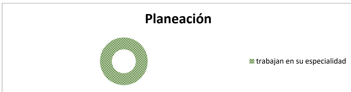
Gráficas 4. Especialidad de planeación

De los alumnos en la especialidad de Planeación que son 3 representan el 100% que no se encuentran laborando en su especialidad, están integrados en hoteles, o agencias de viajes o en otros ámbitos.