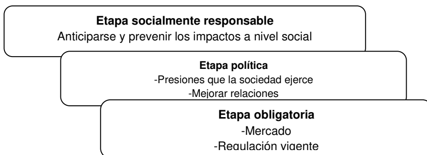
Figura 1. Etapas de la Responsabilidad Social de la empresa